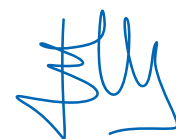
Eneko Goia Laso Donostiar guztien alkatea Alcalde de todos los y las donostiarras

Los próximos años serán fundamentales para el futuro de la ciudad. Debemos tomar decisiones que dibujarán la Donostia del mañana. La finalización de las obras del Topo, la transformación del espacio público, mayor protagonismo para el peatón, la disminución de las emisiones, reforzar el eje del Urumea con la oportunidad que nos brindan los Cuarteles de Loiola, la regeneración urbana del Inferno, consolidar el mapa cultural, la atracción de nuevas actividades económicas, la redacción del Plan General de Ordenación Urbana, la gestión de la diversidad, el sistema de cuidados o el reto demográfico son cuestiones prioritarias para la ciudad.