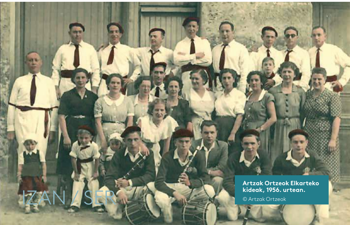
Artzak Ortzeok Elkarteko kideak, 1956. urtean.

Artzak Ortzeok 1921 ean jaio zen. Orduan Intxaurren udalerriaren parte zen, eta Larrotxene baserrian zegoen tabernan egin zituzten elkartearen lehendabiziko bilerak. Gaur, 101 urteren ondoren, esan dezakegu historia handiko mendea izan dela: jaiak, ohiturak, mendi irteerak, txirrindulari taldea, Festara abesbatza, kultur-, kirol- eta irabazi asmorik gabeko jarduerak, aldarrikapenak..., eta hiriko danborrada zaharretako bat , hain zuzen ere, 1956. urtean sortutako danborrada.