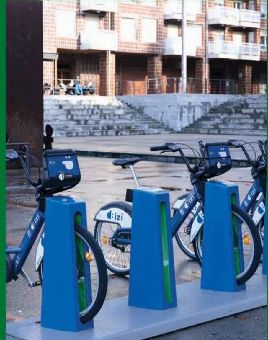
Estación dBizi Gabriel Celaya